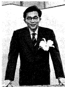
「芥川賞授与式で」の写真